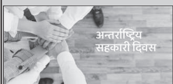
अन्तर्राष्ट्रिय सहकारी दिवस

पाल्पा, असार १५/ आज विश्वभर अन्तर्राष्ट्रिय सहकारी दिवस मनाइँदै छ । नेपालसहित विभिन्न देशमा जुलाई पहिलो शनिबार १६ औं अन्तर्राष्ट्रिय सहकारी दिवस मनाइन्छ । 'दिगो विकासका लागि सहकारी ।' भन्ने मूल नाराका साथ यस वर्ष उक्त दिवस मनाउन थालिएको हो । सन् १८४४ मा बेलायतका रबर्ट ओवेनले सुरुवात गरेको सहकारी आन्दोलनले सन् १९९२ मा संयुक्त राष्ट्रसंघको मान्यता प्राप्त गरेको हो । सन् १९९२ को डिसेम्बर १६ मा बसेको संयुक्त राष्ट्रसंघको साधारणसभाले हरेक वर्ष जुलाई पहिलो शनिबार अन्तर्राष्ट्रिय सहकारी दिवस मनाउने घोषणा गरेयता विश्वभर नै प्रत्येक वर्ष जुलाईको पहिलो शनिबार अन्तर्राष्ट्रिय सहकारी दिवस मनाउँदै आएको छ । नेपालमा भने २०१० सालमा सहकारी सोचको संस्थागत विकास भएको हो । तर २०१३ सालमा बखान सहकारी संस्थाको स्थापनापश्चात् मात्र