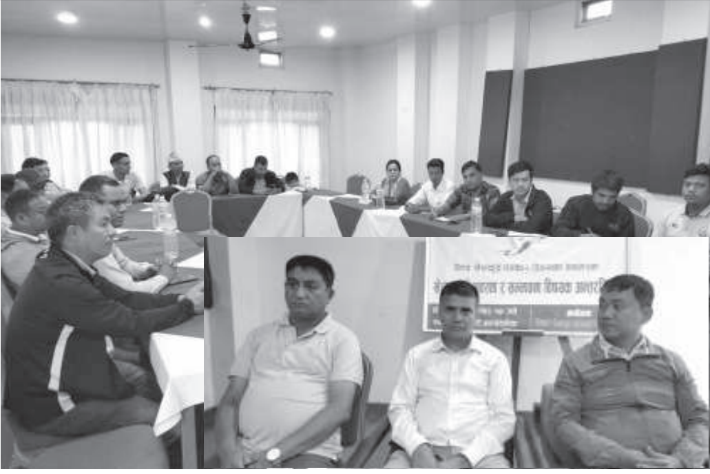
विश्व खेलकुद पत्रकार दिवसको अवसरमा तानसेनमा आयोजित कार्यक्रमका सहभागीहरू । नेपाल खेलकुद पत्रकार मञ्च पाल्पाले दिवसका अवसरमा आइतबार खेलकुदको अवस्था र सम्भावना विषयक अन्तर्क्रिया गरेको छ । मञ्चले जिल्लाका खेलकुद पत्रकार र खेल सम्बद्ध जिल्लाका विशिष्ट व्यक्तिहरूसित अन्तर्क्रिया गरेको हो ।