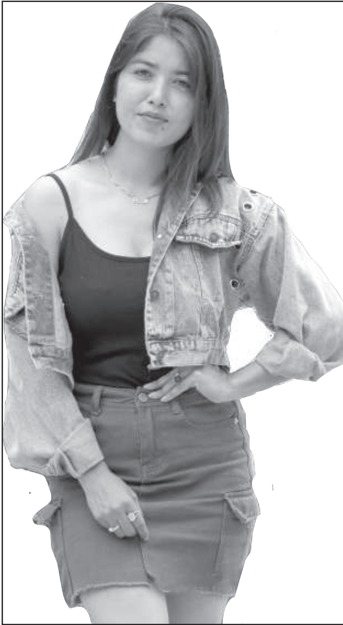
दिनुभएको छ । म तिमीलाई सधैंभरि माया गर्छु । तिमी मेरो जीवनमा तब आयौं जब म टुटेकी थिएँ । तिमी मेरो मुहारको मुस्कान, मेरो आँखामा हाँसो र मेरो जिन्दगीको खुशीको कारण हौं ।'