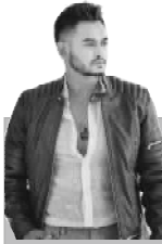
बाइटेन'मा गरेको अभिनेताका कारण थिक्नुभन् । जेनी रिफ्ट राइटर सलेत हुन् ।

NAWA JANACHETANA NATIONAL DAILY राष्ट्रिय दैनिक