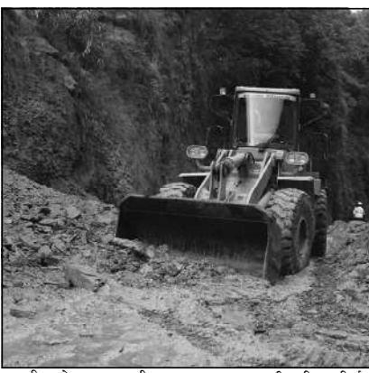
गाउँपालिकाको शूशर र गुल्मीरुद्वार अवरुद्ध सडक स्थानीय पालिका र निर्माण व्यवसायीको पहलमा सञ्चालन गरिएको हो । सडक सञ्चालन भाएसँगै लामो