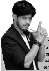
बेलुको पहिरनमा हर्षित मावजा देखाएका छन् ।

NAWA JANACHETANA NATIONAL DAILY राष्ट्रिय दैनिक