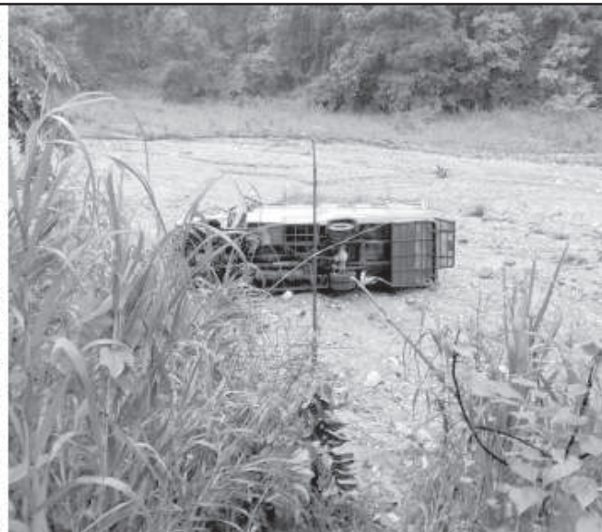
धादिङ र बारामा भएका छुट्टाछुट्टै बस दुर्घटना ।

बसमा अधिकांश भारतीय तीर्थयात्री रहेको प्रहरीले जनाएको छ । उनीहरू पशुपतिनाथको दर्शन गरी घर फर्किँदै थिए । तीव्र गतिका कारण बस दुर्घटना भएको प्रहरीको अनुमान छ । यी दुःखद दुर्घटना नेपालमा सडक दुर्घटनाको कहिलीलाग्दो शृङ्खलाको पछिल्ला केही प्रतिनिधि घटना मात्र हुन् ।