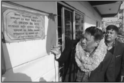
कांग्रेसका केन्द्रीय सदस्य समेत रहेका सिंहले लोकतान्त्रिक व्यवस्थालाई संरक्षण गर्नका लागि कांग्रेसले चुनौतीको सामना गर्न तयार हुनु पर्ने बताए । उनले भने, 'लामो संघर्ष गरेर ल्याएको लोकतान्त्रिक व्यवस्थालाई संरक्षण र

पाल्पा, पौष १७ उपप्रधान तथा सहर विकास मन्त्री प्रकाशमान सिंहले पाल्पाको रामपुर नगरपालिका-५, बेफाडमा निर्माण भएको गणेशमान स्मृति प्रतिष्ठान भवनको उद्घाटन गरेका छन् । नेपाली कांग्रेस रामपुर नगर कार्यसमितिले निर्माण गरेको भवनको राष्ट्रिय एकता तथा मेलमिलापको दिवसको अवसर परेर मन्त्री सिंहले उद्घाटन गरेका हुन् । भवनको उद्घाटन गर्दै उनले गणेशमानले देखाएको बाटोमा कांग्रेस हिडल जरुरी रहेको बताए । उनले अहिलेको अवस्थामा कांग्रेस अग्रज व्यक्तिहरूको योगदानको कदर गर्दै उनीहरूले देखाएको बाटोमा हिडनुपर्नेमा जोड दिए ।