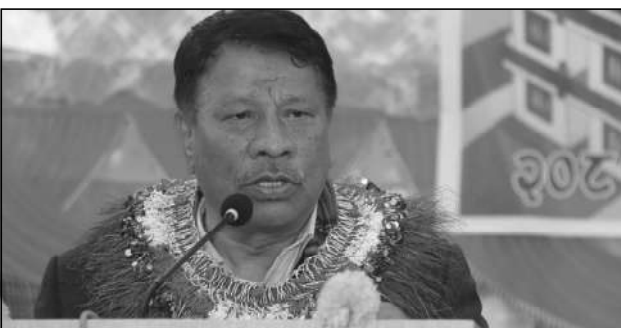
बढ्दो भन्ने रामपुरको विकास थप उचाईमा पुग्ने मन्त्री सिंहले विश्वास व्यक्त गरे । उनले जनतालाई केन्द्रमा राखेर बढ्नु पर्नेमा जोड दिए । यो दल त्यो दल नभनि समाज परिवर्तन र आवश्यक विकासका लागि जनप्रतिनिधिहरू छलफल र समन्वय गरेर अघि बढ्नु अहिलेको आवश्यकता रहेको मन्त्री सिंहको भनाई छ । उनले भने, 'आवश्यक विकास

शशा संवाष्यता पाल्पा, पौष १७ उपप्रधान तथा सहर विकास मन्त्री प्रकाशमान सिंहले पाल्पाको क्षेत्री व्यापारिक केन्द्रको रूपमा रहेको रामपुर सम्भावना सम्भावना भएको ठाउँ रहेको बताएका छन् । शहीद बहुमुखी क्याम्पसमा आयोजित धनधान्यान्वयन श्रीसद्व्यागवत् ज्ञान महायज्ञ एवं धार्मिक महोत्सवको उद्घाटन गर्दै उनले यहाँ प्रचुर सम्भावना भएकाले आधुनिक नमूना शहरको रूपमा विकास गर्न सकिने बताएका हुन् ।