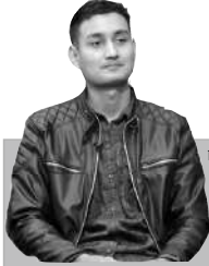
दुई दिनअघि अर्थात् फागुन १४ गते भने फिल्म "लाज शरणमा" प्रदर्शनको तयारीमा छ ।

NAWA JANACHETANA NATIONAL DAILY राष्ट्रिय दैनिक