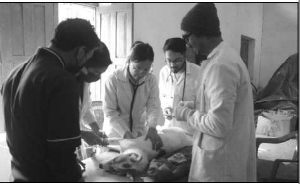
भरतपुर चितवनको प्राविधिक सहयोगमा शिविर सञ्चालन गरी एक सय १२ वटा कुकुरको बन्ध्याकरण गरेको छ । शिविरमा कुकुरको बन्ध्याकरण तथा रेजिज भ्याक्सिनको सेवा दिइएको थियो ।

पाप्पा, फागुन ३/जिल्लाको रामपुर नगरपालिकाले विगत तीन वर्षको अवधिमा तीन सय बढी सामुदायिक कुकुरको बन्ध्याकरण गरेको छ । सामुदायिक कुकुरको व्यवस्थापन र रेजिजको जोडिम न्यूनिकरणका लागि नगर सरकारले शिविरमार्फत सञ्चालन गरेको अभियानमा तीन सय ९ वटा कुकुरको बन्ध्याकरण गरेको हो । कुकुर व्यवस्थापन हुन नसकेको गुनासो आउन थालेपछि नगर सरकारले बन्ध्याकरण र रेजिजविशुद्ध खोप अभियान सञ्चालन गर्दै आएको छ । नगर सरकारले गत बृधवारदेखि शुक्रबारसम्म तीन दिन बन्ध्याकरण शिविर सञ्चालन गरेको थियो । उसले नातावरण तथा सामाजिक स्थानरक्षणका लागि युवा सिद्धार्थ नगर स्पन्देही र मानव पशु तथा बानी संरक्षणका लागि युवा