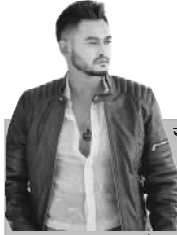
"सुपरस्टार"को दर्जा दिँदै उनका दर्शकलाई मात्र र्शान दिइएको छ ।

NAWA JANACHETANA NATIONAL DAILY राष्ट्रिय दैनिक