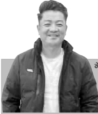
प्रतिक्रिया प्राप्त गर्नुको । फिल्म हेरेर निस्किएर देखाको आँसुमा आँसु देखिएको थियो ।

NAWA JANACHETANA NATIONAL DAILY राष्ट्रिय दैनिक