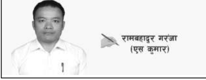
मानिसको इच्छा पनि बलियो हुन्छ कि ? दाजुभाइ रिसाउनु भन्ने तनाव थियो । चारैतिरको तनाव विचवाट दशै विडामा प्रमगमा जाने उतै बञ्जी जम्प पनि हान्ने मेरो एकल इजलासले फैसला भयो र सराइइल स्वरूप सुरभालाई उक्त फैसला सुनाए । उनी पनि सुरमा अचम्म मान्दै त्यसो नगर्न सक्नाहँ र्दिन्छु । तर पछि फँसला कर्मन्यन्यका लागि तयार भइँ । जहाँ इच्छा, त्यहाँ उपाय भने कै इच्छा भएपछि उपाय पनि आउँदो रहेछ । घरमा आमा र बाबालाई सम्झाइ बुझाइ केही खानेकुटा, कपडा र आवश्यक सामानहरू प्याक गरी दाइबाट २०८१ साल असोज २३ गते घुम्नार आ एक हप्ताको लागि बाइको यात्रा प्रमगमा निस्कियो । गर्मीको मौसम सकिँएको र जाडो नआइसकेको बेला भएर होला हामीलाई यात्रामा कुनै समस्या भएन । भर्खर भर्खर वर्षाको विदाइ र शरद श्रुतिको आगमनले गर्दा मौसम निकै सफा थियो, हरियाली वनजङ्गलमा चराचुरीको सुमधुर आवाजहरू, बाटा घाटा र बस्तीहरू उतिकै सुन्दर र चटक देखिन्थे । यस्तै रामझला दृश्य निगान्दै हामी भूटवल शुभिला बनीको कोठामा गएर बास बस्यौ । उनको न्यानो स्वागतसँगै खाना खाएर निश्चय गर्यौ । उनी हाम्रो बैनी भएकै साथै पनि हुनु किनकि हामी विचमा सुहृद र दुःख अन्तरमनका कुराहरू साटासाट हुन्छौ । २४ गते विहानै पूर्वमा लागी छाउँदै थियो हात मुख धोएर मनतातो पानी पिइ तिनाउ नदीको किनारै किनारै विचमा पुगेर नास्ता खाद्यौ । आफ्नै रफ्तारमा सुत्नेदेखि बरिपरिहेको कालीगण्डकीलाई निगान्दै राम्दी पुन तरेर नदीको पारमा पुगेर नास्ता खाद्यौ । यात्रामा बाटाघाटा, चौकोचोक र गाडीहरूमा भोला सहितका मान्छेहरूको भिडभाड देखिन्थ्यो । शायद उनीहरूकै दर्शको आगमनलाई स्वागत गर्न हतार थिए । सुन्दर सहर पोखरा, पर्यटकहरूको आकर्षणको केन्द्रविन्दु, पोखरामा खाना खाद्यौ । त्यहाँ एक बल क्रमकै पनि हिलो भएको थियो भन्दा । किनकि बञ्जी र स्विडको भन्ने शोरमा ४/५ को मेरुमा सवार गरिरहेको थियो । पोखरा सहरलाई फर्किदा भेट्ने बाचासहित लाग्यो पर्यटको कुशमातिर । यो चाडबाडका बेला हामी मात्र हो कि ? बाहिर निस्कने भनेको त सडकमा गाडीहरू, मोटरसाइकल र स्कुटीमा झुन्डो झुन्डो मोलासहित सिंगल, युगल र सामुहिक रूपमा कुरमा, बागुज, म्यादी, मुस्ताड, मुक्तिनाथ लगायतका स्थानमा घुम्न जाने मान्छेहरूको लावा लस्कर देखिन्थ्यो । जसले गर्दा हामीलाई थप हैसला प्रदान गर्नु । जे हो अहिलेका घुम्न जाने मान्छेहरूको लावा लस्कर देखिन्थ्यो । जसले गर्दा हामीलाई थप हैसला प्रदान गर्नु । जे हो अहिलेका घुम्न जाने मान्छेहरूको लावा लस्कर देखिन्थ्यो । जसले गर्दा हामीलाई थप हैसला प्रदान गर्नु । जे हो अहिलेका घुम्न जाने मान्छेहरूको लावा लस्कर देखिन्थ्यो ।