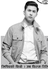
विशेषाचारको थियो । जब फिल्म रिलिज भयो, त्यसपछि उक्त जल्लोको पहिचान नै भएरियो ।

NAWA JANACHETANA NATIONAL DAILY राष्ट्रिय दैनिक