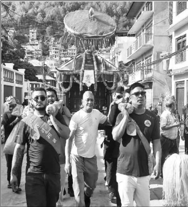
पाल्पाको सदरमुकाम तानसेनमा शनिबार निकालिएको हनुमानको रथयात्रा । प्रत्येक वर्ष चैत्र शुक्ल पूर्णिमाका दिन रामभक्त हनुमान जन्मजयन्ती मनाउने गरिन्छ । हनुमानको पूजा आराधना गरेमा बल, वृद्धि, विद्या मिल्ने, दुःख र सङ्कटबाट मुक्ति पाइने विश्वास छ ।