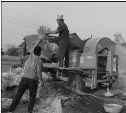
प्रयोगले खेती गर्न सजिलो भएको छ ।

यहाँका किसानलाई नगदेबाली भित्र्याउन प्याइन्ध्याइ छ । किसान गहुँ, जौ, तोरी र मुसुरो धन्याउन व्यस्त छन् । अधिकांश किसानले यन्त्र प्रयोग गरेर बाली भित्र्याउने गरेका छन् ।