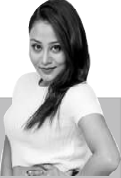
आवार्ड समेत जितिसकेको फिल्मले टेलरबाट अशक दुर्योगमाको संकेत गरिसकेको छ ।

अहिजेनी मलिका महतलाई जूताको माला र कालोमोले दलेको अवस्थामा प्रस्तुत गर्दै पहिलो पोस्टर आर्जजतिक भएदरिने ले चर्चामा रहेको फिल्म 'सतीदेवी' कृष्ण जन्माष्टमीको अवसर पारेर चर्चा शुरुभार अर्थात् अठौको ७ गतेबाट प्रदर्शनमा आउँदैछ । प्रदर्शनपूर्व नै केही फेस्टिभलमा महत्वपूर्ण विद्यामा