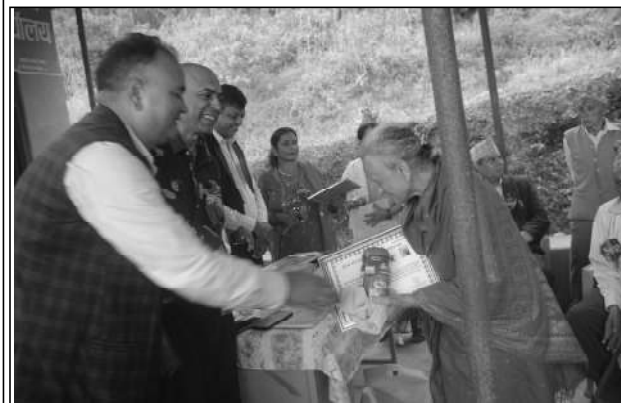
जेष्ठ नागरिकलाई सम्मान गरिँदै ।

पाल्पा, भदौ २६/तानसेन नगरपालिका -९ दमकडामा जेष्ठ नागरिकलाई सम्मान गरिएको छ । अघेरी छरछरे सामुदायिक वन उपभोक्ता समिति दमकडा र पंथी संरक्षण संघले १६ औं अन्तर्राष्ट्रिय मिड सचेतना दिवस तथा समितिको २६ औं वार्षिक साधारण सभाको अवसरमा जेष्ठ नागरिकलाई सम्मान गरेको छ ।