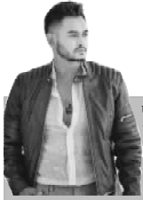
आफू सहमतिले फिल्मबाट अलग भएको जानकारी दिइनु ।

NAWA JANACHETANA NATIONAL DAILY राष्ट्रिय दैनिक