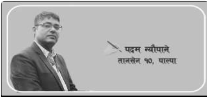
पदम न्यौपाने तानसेन १०, पाल्पा

बजारमा आउनेहरू मध्ये सिमित संख्याका मात्र आफ्नो निश्चित काम सम्पन्न गरेर फर्किने हुन्छन् । अधिकांश भने निजि कामका साथै आफू सम्बद्ध वा आवद्ध विभिन्न संघ, संगठन, समाज वा सामाजिक, सामुदायिक संस्थासँगको सम्पर्क रहने गर्छन् । त्यहीबाटै उनीहरू शिक्षित, प्रशिक्षित हुने वा सुचना लिने, जिज्ञासा राख्ने वा बुझ्न खोज्ने गर्छन् । किनकी उनीहरू चाहान्छन् त्यहाँबाट पाएको सुचना वा जानकारी बाट आफ्नो क्षेत्रमा पुऱ्याउन चाहान्छन्, परिवर्तन वा रूपान्तरणमा आफू पनि सहभागी हुन चाहान्छन् । तर दुर्भाग्यपूर्ण सत्य के हो भने उनीहरू सम्पर्क रहने सम्बद्ध संस्थाहरूबाट उत्साही हुने भन्दा पनि निरुत्साहित भएर पकिँनु पर्ने अवस्था रहेको टिप्पणी गर्दछन् ।