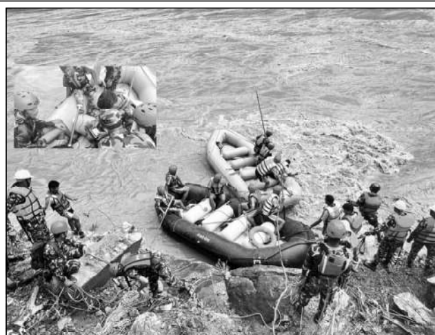
किलोमिटर क्षेत्रमा खोजी कार्य गरिरहेको छ ।