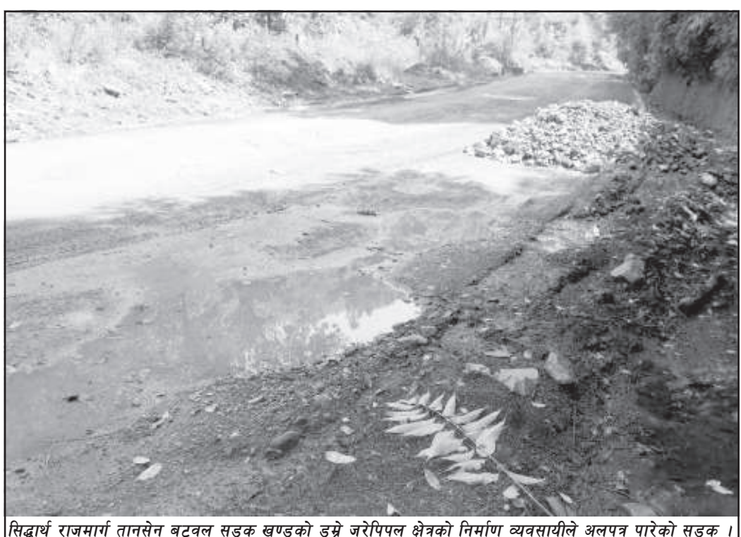
सिद्धार्थ राजमार्ग तानसेन बुटवल सडक खण्डको डुम्रे जरेपिपल क्षेत्रको निर्माण व्यवसायीले अलपत्र पारेको सडक ।