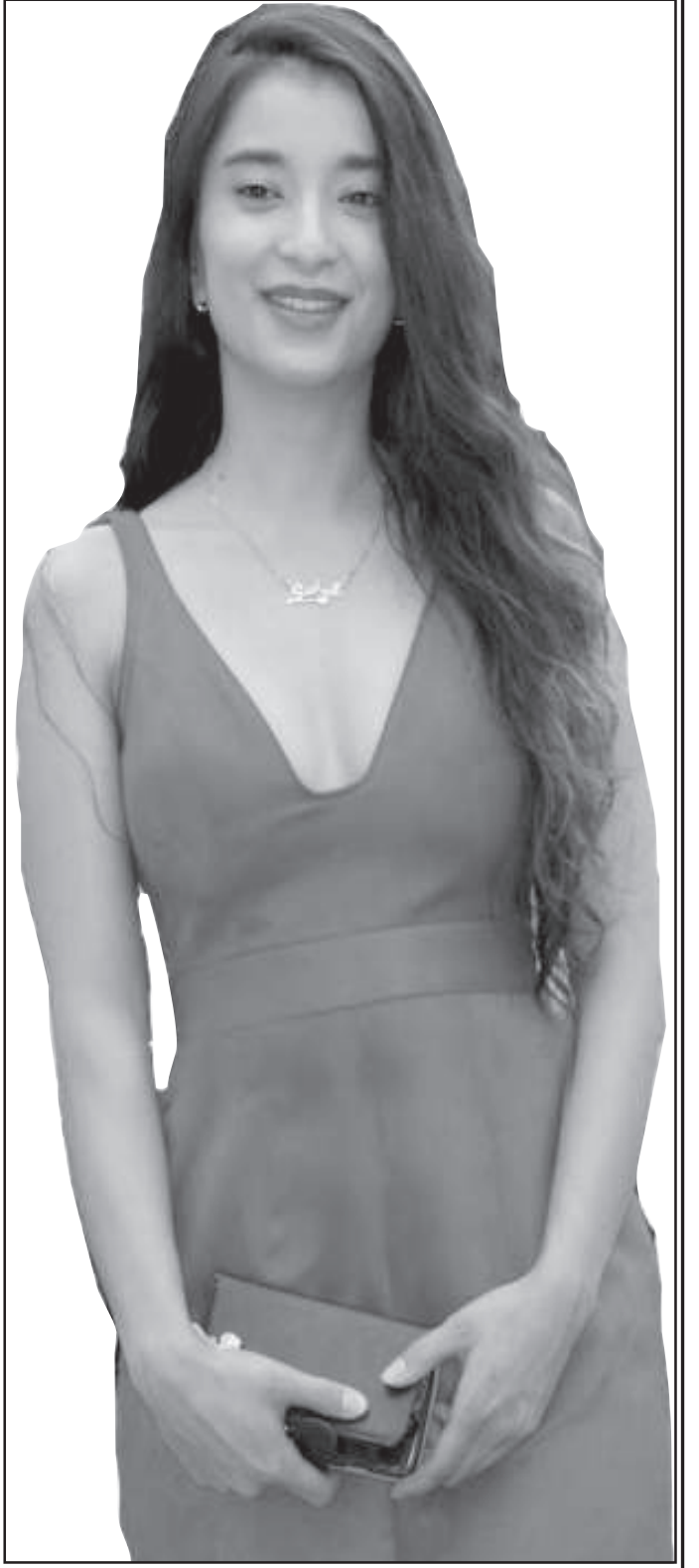
आफूलाई प्रमाणित गरिसकेकी छन् ।